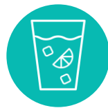
Agua de frutas