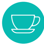
Café ecológico, té y galletas