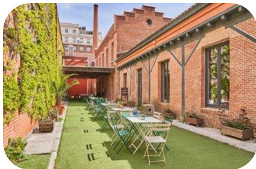
DISFRUTA LA EXPERIENCIA DE TRABAJAR