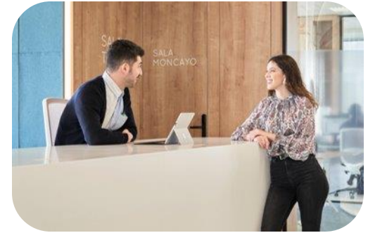
UN EQUIPO PARA CUIDARTE