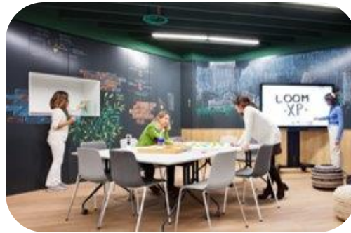
100% A TU MEDIDA