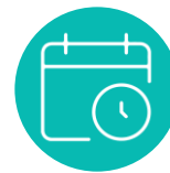
Agenda de actividades