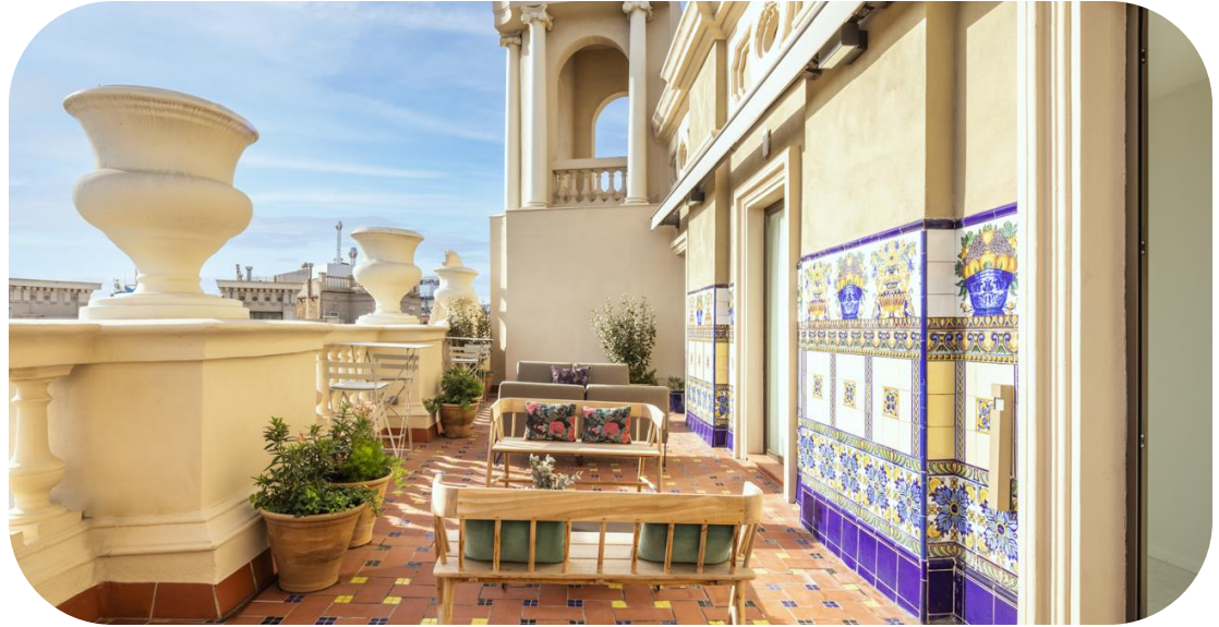
Terraza Plaza Catalunya