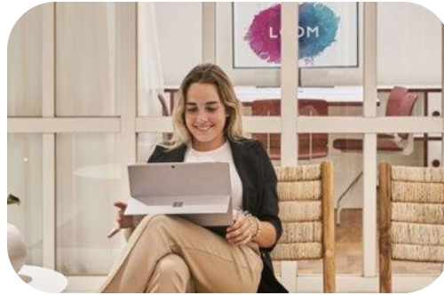
NOS ANTICIPAMOS A TUS NECESIDADES