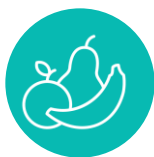
Fruta de temporada